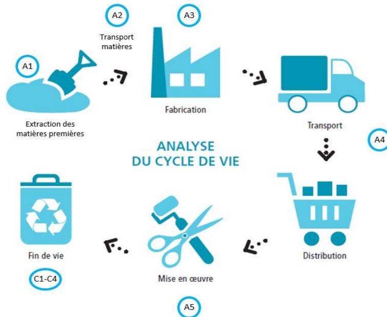
Diagramme du cycle de vie du produit :